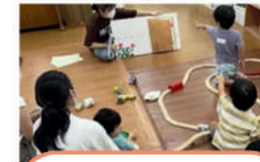
NPO法人 さくらザウルス 子育て支援