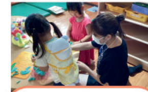
NPO法人 びーのびーの 子育て支援