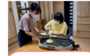
NPO法人 地域生活センター 障害者福祉