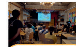
NPO法人 横浜 NGO ネットワーク 国際協力