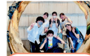
NPO法人 横浜市民アクト まちづくり・市民活動支援