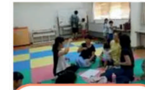
NPO法人 グリーンママ 子育て支援