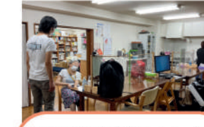
障害者自立生活センター IL・NEXT 障害者自立支援