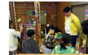
NPO法人 教育支援協会南関東 子ども・若者の学び、 体験を促進