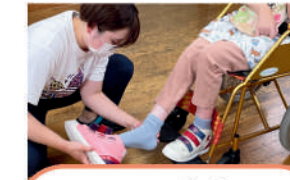
NPO法人 みどり福祉ホーム 障害福祉・地域支援