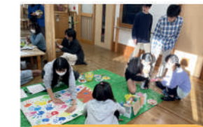
NPO法人 ビビビ・親子サポート ネット 子育て・介護・障がい支援・ 学齢期児童の居場所