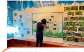
公益財団法人日本野鳥の会 「横浜自然観察の森」 環境保全 (教育・調査・管理)