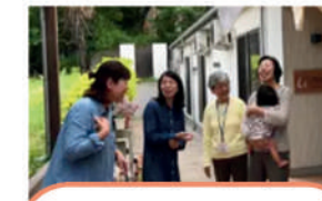
NPO法人 スマイルオブキッズ 病気や障がいがある 子どもたちの支援