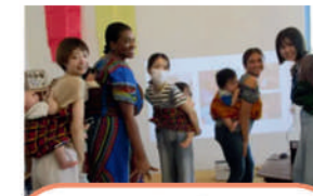
NPO法人 こども応援ネットワーク 子育て支援