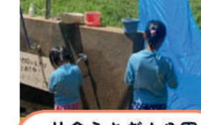
片倉うさぎ山公園 遊び場管理運営委員会 プレイパーク (屋外の子どもの遊び場作り)