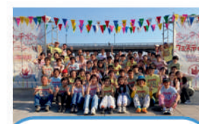
NPO法人 アークシップ まちづくり、アート