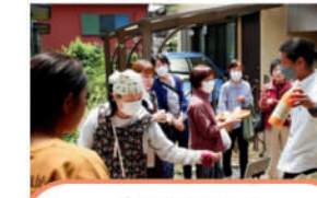
生活クラブ 生活協同組合・神奈川 暮らしを豊かにする 事業