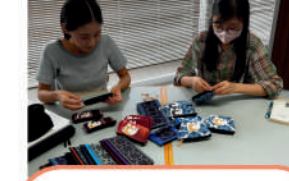
国際協力 NGO Act for Child 国際協力