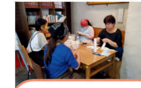
NPO法人 ぐらす・かわさき コミュニティカフェ・ 市民活動支援