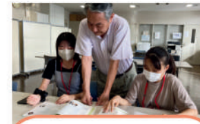
NPO法人 リロード 自立支援・社会教育活動